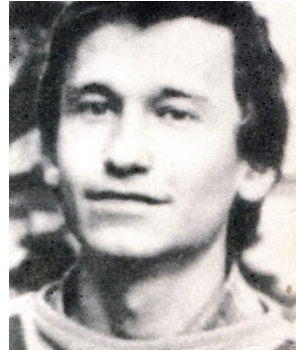
Аттила Могильний