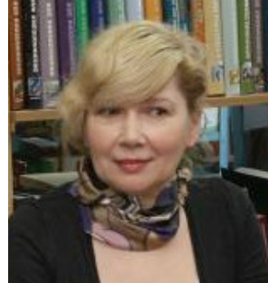
Марина Пузиренко

Для розвитку спостережливості у дітей, зокрема до деталей книжкової ілюстрації; розвитку дрібної моторики; вивчення назв і зовнішніх прикмет тварин, птахів рекомендуємо провести воркшоп зі створення віммельбуха за книгою Олесі Квітки (з ілюстраціями ювілярки цього року — художниці Марини Пузиренко) — «У морі», «У лісі», «У джунглях», «У домі» та ін., використовуючи аркуші формату А5, А6, матеріали для розфарбовування (олівці, фарби, гумки тощо), ватман із підготовленим зображенням, клей, ножиці (для роботи офлайн). Також необхідний оцифрований фон для віммельбуха достатньої роздільної здатності, створений за допомогою комп'ютера, сканера, програми для обробки зображення (обрізати, зберегти), та інтерактивна дошка/екран для виводу зображення.